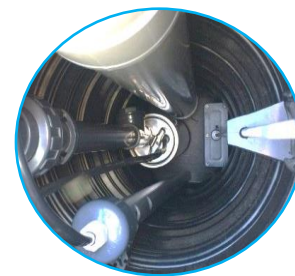
Option Irrigation avec système IRRIGO Evolution®

INSTALLATION : En complément du livret utilisateur (qui comprend les instructions de pose spécifique à cette machine), fourni avec l'unité d'épuration, l'installateur devra respecter les règles du DTU 64.1. « Mise en œuvre des petites installations d'assainissement autonome ».