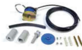
EF - 27 ** Frein électrique par série 227