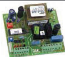
Carte électronique de commande 200 MPS