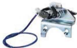
Dispositif anti-chute (conforme norme EN13241-1)