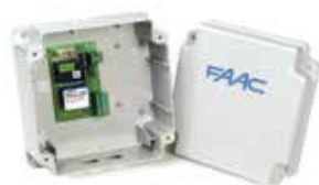
Centrale avec logique « homme mort » 200 B.T.