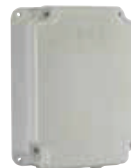
Boîtier mod. E compatible avec les cartes