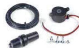
Frein électrique R 180 - R 280*