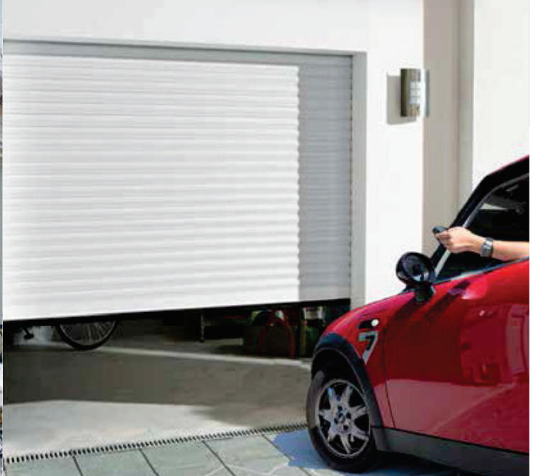
PORTE DE GARAGE ENROULABLE