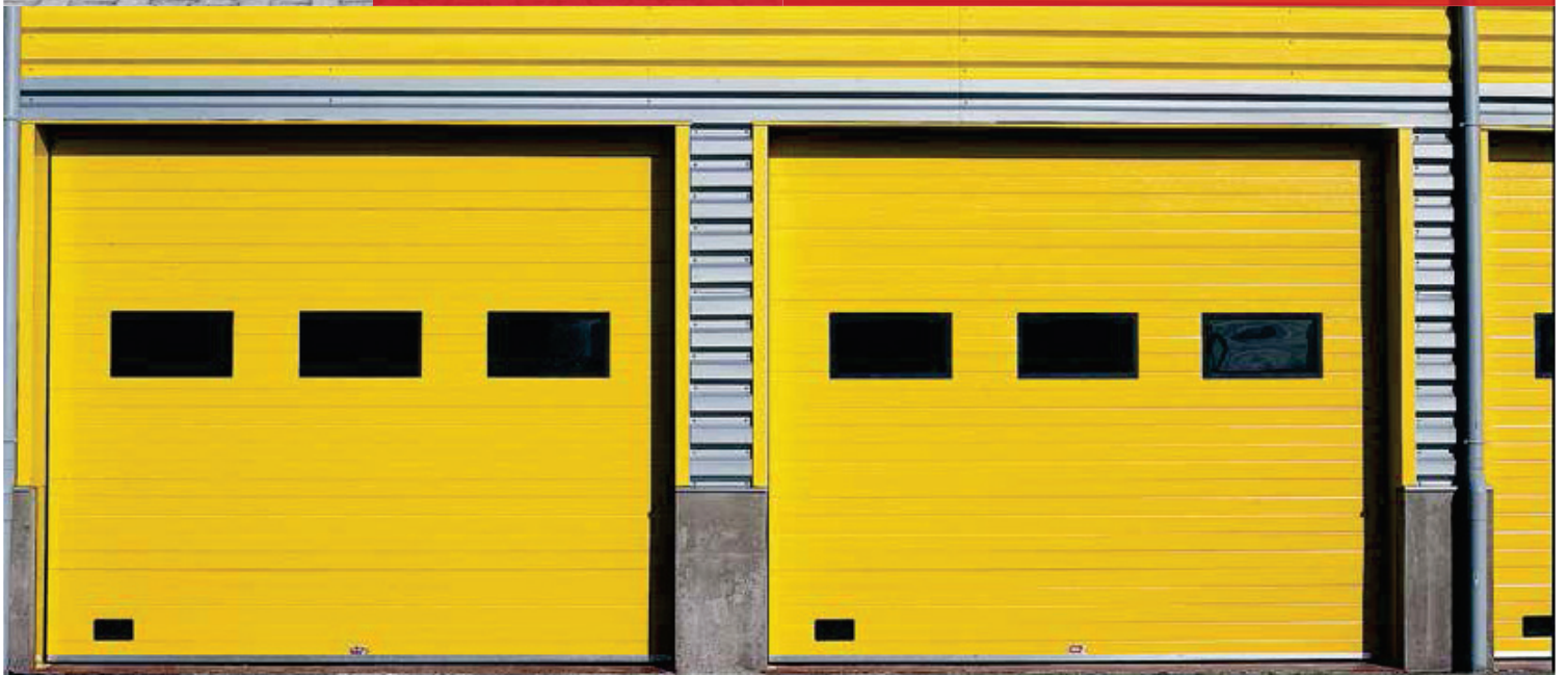
MISE EN OEUVRE SIMPLE ET RAPIDE